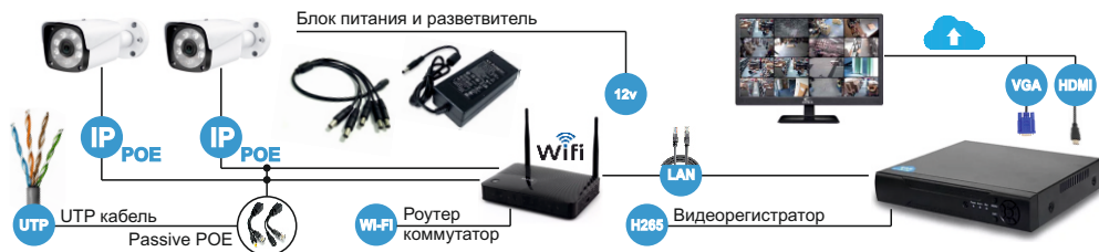
Схема подключения проводной IP POE системы видеонаблюдения с помощью комплекта инжектора и сплиттера Passive POE

2. Подключение через пассивный комплект PPOE-Light. Комплект состоит из двух адаптеров: Инжектора и Сплиттера. Обеспечивает подачу напряжения питания через стандартную витую пару для удалённых устройств. Питание подается по свободным витым парам 4-5 и 7-8, которые не используются для передачи данных. Комплект эффективен для использования в существующей сетевой инфраструктуре, позволяя применять технологию POE для устройств, не оснащенных данной функцией изначально. Подсоедините камеру UTP проводом через комплект Passive POE, при этом потребуются отдельный блок питания 12в.